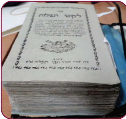
אך ה' הזמין לי על ההוצאות. הכריכה של ליקוטי תפילות העתיק