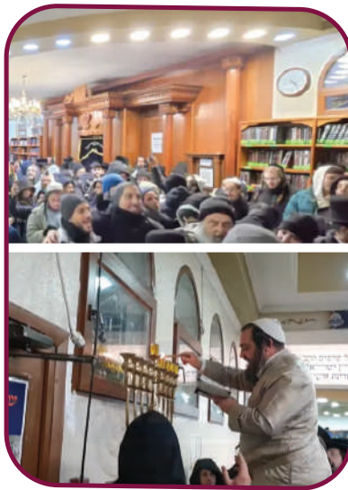
הגיעו למאות הדרכים הארוכות. הריקודים והדלקת נר חנוכה במוצאי שבת בציון הקדוש

למרות משבר התעופה והמחסור בטיסות בישראל בעקבות המלחמה המתמשכת בארץ, כשבנוסף לזה השמיים באוקראינה סגורים לטיסות אזרחיות והנוסעים לאומן נדרשים לנוע בדרכים יבשתיות במשך שעות ארוכות, אלפי חסידי ברסלב לא התייאשו, ולמעלה מ-3,000 איש הגיעו להשתתף בקיבוץ הקדוש של שבת חנוכה.