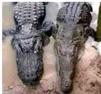
למי שלא יודע להבדיל בין תנין לקרוקודיל. הקרוקודיל נמצא לצד התנין.