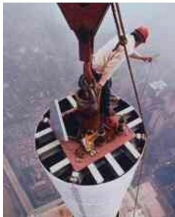
אדם מתקן את האנטנה במרכז הסחר העולמי, ניו יורק, שנת 1979.

הגעתי למסקנה שהסופגניות הן האויב שלי ועל אויבים כתוב ארדוף אויבי ואשיגם ולא אשוב עד כלותם.