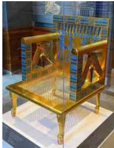
כיסא הזהב של אישתו של פרעה.