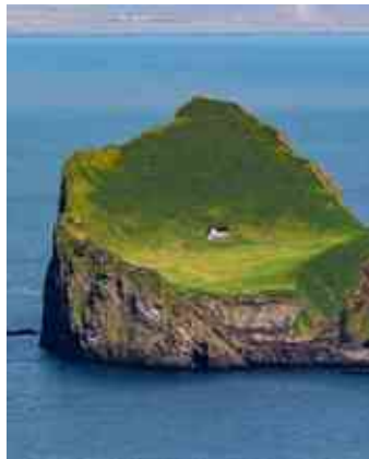
איסלנד. הבית המבודד בעולם

הגעתי למסקנה שהסופגניות הן האויב שלי ועל אויבים כתוב ארדוף אויבי ואשיגם ולא אשוב עד כלותם.