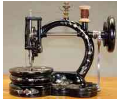
מכונת תפירה יצור של שנת 1867.