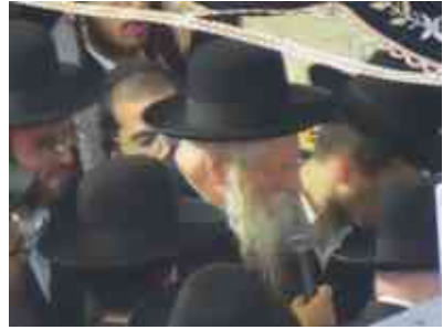
חופה ביום רביעי נר שביעי של חנוכה

מה שאבא שלי (- יצחק) לימד אותך? זה למדת אצל אבא? היית בחיידר, [אליפז] (הוא היה בחיידר נחמת ציון, אחרי זה הוא עבר לאמונת ציון, לנחלי נצח, אחרי זה הוא עבר לכלפה, ואחרי זה הוא עבר ללמוד בחיידר ליטאי, אצל עשו...), ושם הוא למד שכיבוד אב ואם זה לפני לא תרצח אבל אנחנו לומדים שלא תרצח זה לפני כיבוד אב ואם, אז יצחק לימד [את אליפז], אז תעשה מה שיצחק לימד אותך, ותדע לך שלא תרצח זה לפני כיבוד אב ואם, כי גם עשו חייב בלא תרצח. אז אליפז אומר: טוב, תן לי את הבגדים שלך.