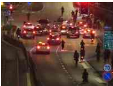
מורינו הרב חוזר מהכנס לבחורי החבורה

שיבוא משיח, ואחרי משיח, ותחיית המתים, [וכשראה כך הרגם], אומר ר' נתן: לא, אין דבר כזה, אפשר בכל אחד להכניס טוב, אם נשמה ירדה לעולם אפשר להחזיר אותה בתשובה, לא צריך לשים אותה בחאן יונס ולא ברפיח, [כלומר לא צריך שיחטפו אותם חמאס כדי לתקנם, אלא אפשר להחזירם בתושבה עוד קודם ולא יצטרכו להיהרג או להיחטף].