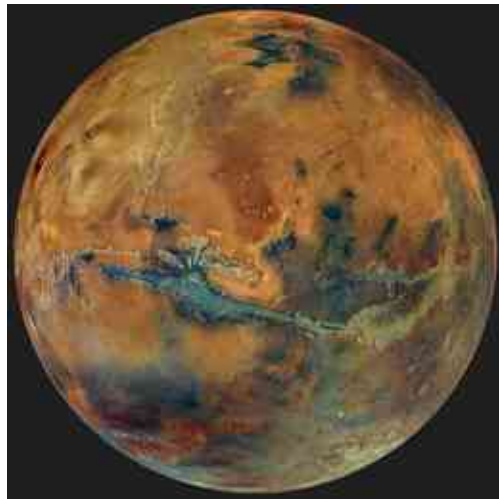
התמונה הברורה ביותר של מאדים שצולמה אי פעם.