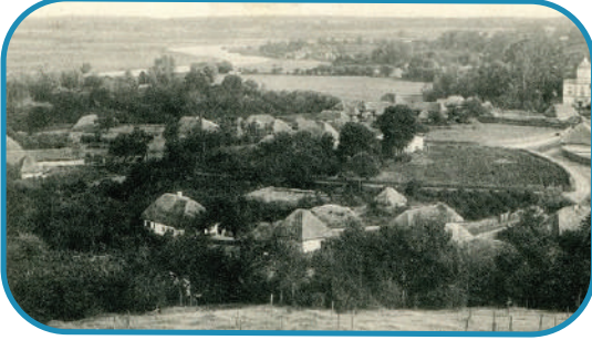
גדל בבית רבי נתן והמשיך את דרכו. תמונה עתיקה של העיר ברסלב

ה וא היה 'ליקוטי הלכות' מהלך, לכל מאורע ולכל דבר נתן פירוש פנימי ושורשי ממעיניו של מורו ורבו. כשנגב ממנו פעם חפץ בעל ערך, החל הוגה בהלכות גניבה בשולחן ערוך עם ה'ליקוטי הלכות' הנלווים אליהן, עד שהוחזרה אליו הגניבה על ידי הגנב עצמו – ויהי לפלא.