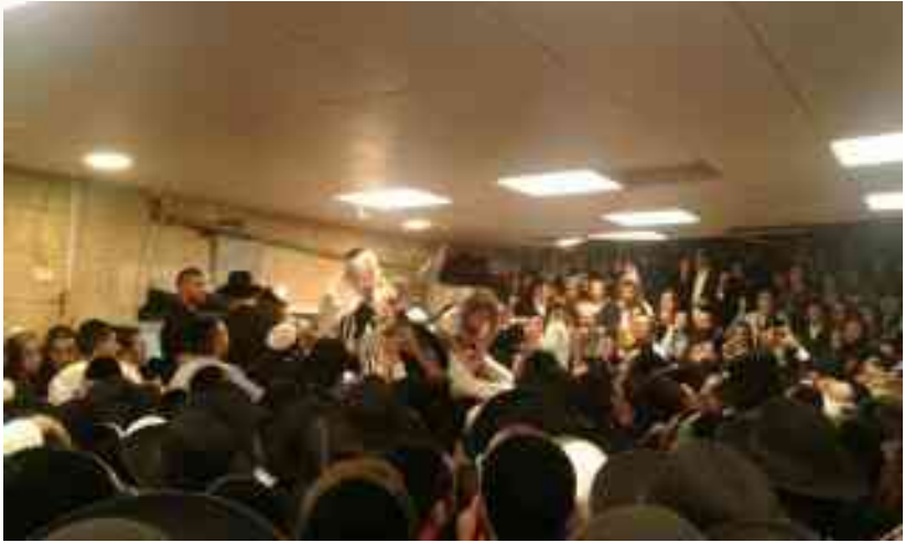
תפילת מעריב באולם למטה לפני כשבע שנים

תירא" אני אתן לך לאכול לשתות, "מים שאל חלב נתנה", היא הביאה לו חלב סמך. "ויסר אליה האהלה", "ותכסהו בשמיכה", דבר ראשון זה שמיכה, היא כסתה אותו בשמיכה, אז אמר ריש לקיש "שמי כה" 27 , מה זה שמיכה? שמי כה, ששם ה' [מעיד עליה] שהיא לא נגע בה, מהו שמיכה? שמי כה, שמי מעיד עליה, ואחד אומר זה היה גיגית, פיילה, [כלומר שיעל