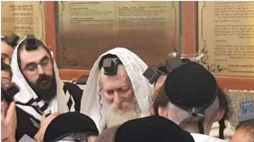
מורינו הרב על הציון באומן בתפילת שחרית

ומאחר שאין אשה אלא לבנים (תענית לא א כתובות נט, ב) וכל שלמות הולד במדות וכרעות תלוי בזמן הזווג וככונת הזווג, אי לזאת לו ככה ולו כחיל יגבר איש לקים מצותו דבר בעתו ויתאמץ במצותו איש ואשתו לחשב מחשבות טהורות זכות וברות, וזר לא יקרב במחשבותם שום מחשבה זרה, כי קרוב הוא להיות בעילתו בעילת זנות ונפש הם חובלים ובנים זרים ילדו רעים וחטאים ומפשים בנים משחיתים כל מום בם. ומה יתאונן