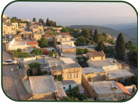
עסק בה בתורה ללא הפסקה: העיר צפת

"בכל שבת נתאספו לביתו חסידי ברוסלוב לאכול סעודה שלישית, ועסקו בספר הק' 'ליקוטי מהר"ן', ושרו כל הזמירות עד שעה מאוחרת בערב."