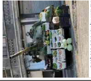
טקט נטוש של צבא סוריה הפך לחנות ירקות.