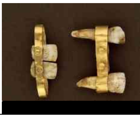
שיניים תותבות חלקיות המורכבות מזוג שיניים במעמד זהב, אטרוסקי, 600 לפני הספירה.