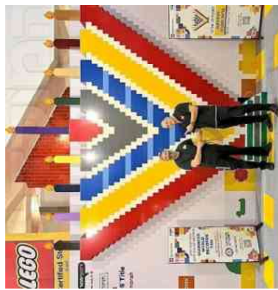
חנכיית הלגו הגדולה בעולם. בחמת של לוגו ישראל בדיזינגוף סנטר. 136 אלף חלקים.

רעידת האדמה ב-11 במרץ 2011 ביפן, בעוצמה של 8.9 בסולם ריכטר, גרמה להשפעות גיאולוגיות משמעותיות: יפן זזה ב-2.4 מטרים ממקומה המקורי, וציר כדור הארץ עצמו זז ב-10 סנטימטרים.