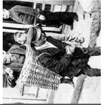
"הסל השיכור". בשנות השישים שכו באיסטנבול מישורו שיוביל אנשים שיכורים לבתיהם.