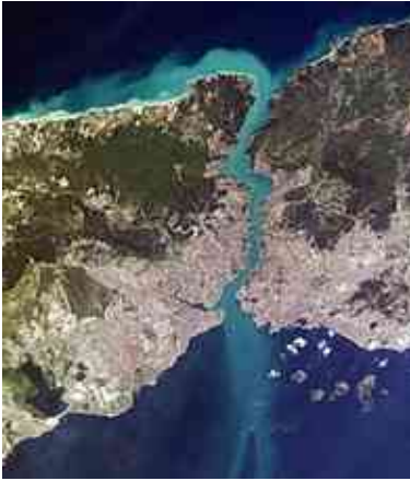
מיצר בוספורוס והדדגנלים