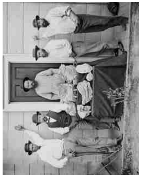
גושי זהב שנכרו על ידי כורים. אוסטרליה. 1851