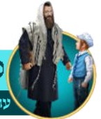
עובדות והלכות על המינוח החשובה