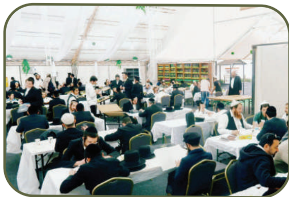
רבבות שעות של לימוד תורה בימי הקיבוץ: אחד מהיכלי התורה באומן