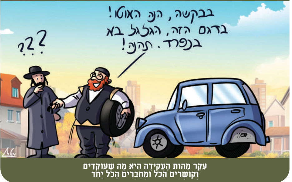
עקר מהות העקידה היא מה שעוקדים וקושרים הכל ומחברים הכל יחד

ר' נתן שואל שם מדוע העקדה נקראת עקדה על שם עקידת הרגילים ואין היא נקראת על שם עריכת העצים או בניית המזבח וכדו' שהרי הכל היה חלק מהניסיון של אברהם אבינו?