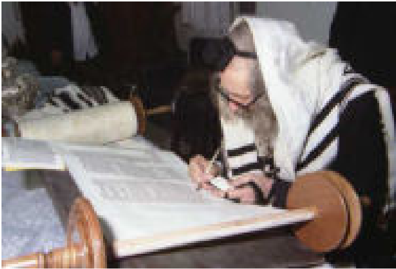
תמונות משנים עברו

ברית מילה, וענר ואשכול אומרים לו בשום אופן לא, תדע לך אנחנו [להגן עליך], יהרגו אותך, כתוב במדרש תנחומא, כל העולם מחכה להרוג אותך, יש פה גואלי דם, אתה שכחת שהרגת שני מיליארד אנשים שש מאות מיליון 8 , אתה הרוצח הכי גדול ארכי רוצח, ביידן משתגע, האריס משתגעת מה הוא עושה לפלסטינאים, אנשים חפים מפשע, אנשים ממש קדושים וטהורים. אברהם פחד אולי הרגתי צדיק, ה' אומר לו אנוכי מגן לך, זה היה בגיל 75, היום אתה כבר בגיל 99, עברו 24