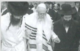
הרב שליט"א בדרכו לקלוז בערב ראש השנה