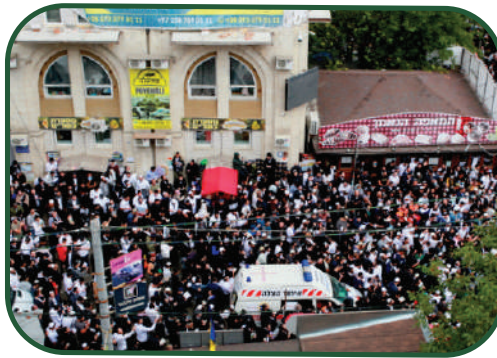
הולך ומתמלא משעה לשעה, אומן ראש השנה אשתקד

בתוך כך, חשש כבד ביותר שורר בליבם של חסידי ברסלב. שמא הדבר יביא לסגירת השמים של ישראל, ולעצירת הטיסות בנתב"ג, מה שימנע מרבבות המתכוננים לטוס לאומן את היציאה מהארץ. החשש גדול עוד יותר, לאחר השנים האחרונות, החל משנת הקורונה, אז נמנע מרובם של חסידי ברסלב להשתתף בקיבוץ הקדוש. במהלך השנים האחרונות, מאז פרוץ