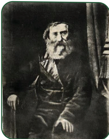
רבינו המלבי"ם זצ"ל. לחם בהשכלה בכל כוחו

"שבו ואספר לכם סיפור מעניין שאירע לפני מספר שנים בעיירות אירופה".