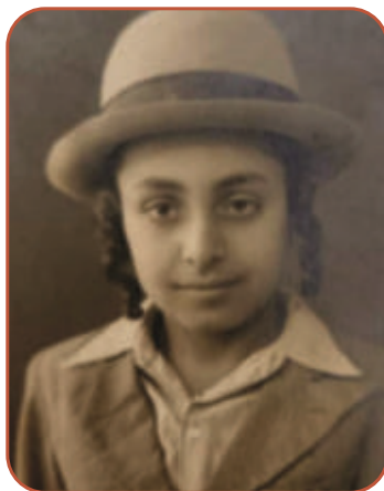
תשובתו של הרב הותירה אותי בהלם. הרב בעדני בהגיעו לגליל מצוות

אחרי מספר פעמים שניסיתי לענות טענות מענות