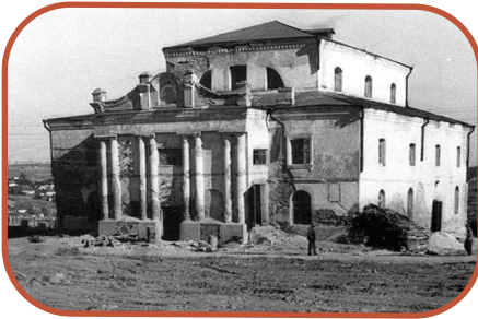
איש לא יצא מפתח בית הכנסת: בית הכנסת המרכזי בעיר אומן לפני כמאה שנה

שלשה ימים השתוללו הפורעים: ה' ו' ו-ז' בתמוז, לא נחו ולא שקטו, עברו שוב ושוב על הררי הגופות, דקרו ושיסעו ויהי מספר ההרוגים, בעיר ומחוצה לה, שלושים אלף.