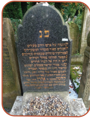
אין לו עוד הרבה קלמישים. קברו של בעל 'המאור ושמש'

עם הגיעו לליז'ענסק הבין קלונימוס קלמן כי קשה יהיה עד מאד להיות תלמיד. הרבי ר' אלימלך לא הסכים לקבל קהל והדלת הייתה סגורה ומסוגרת עבור אברך צעיר בגילו, ומשכך הוא הגה רעיון, הוא פנה אל מי שהיה