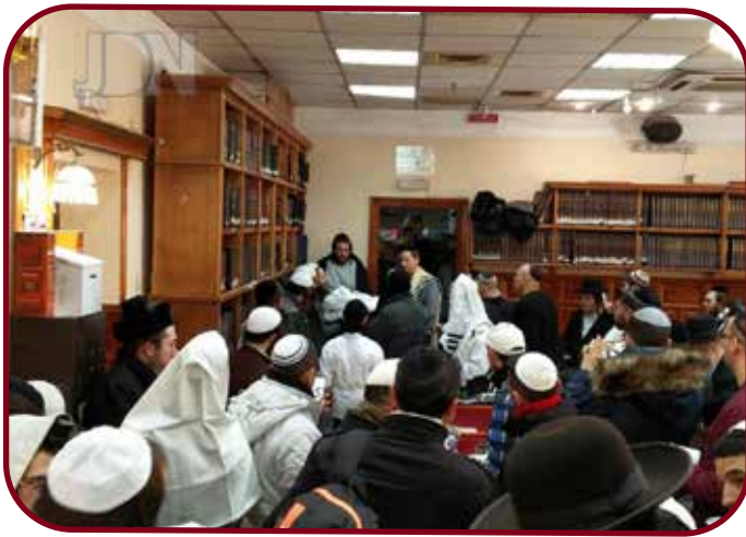
ישועה אחרי תשע שנים: מעמד ברית בציון רבינו הקדוש באומן

אבל זה היה רק ההתחלה, תקופה אחר כך השתתפתי בכינוס גדול נוסף כאשר במהלכו צעק אחד המשתתפים על משתתף אחר, ובייש אותו מאוד. "לאחר תום הכינוס" מספר הרב פריוף "החלטתי שהפעם אני ינצל את ההזדמנות הזו בעקבות כך שיש לי אח אשר מחכה שנים רבות לילדים ועדין לא נועש".