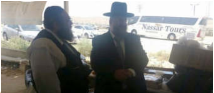
הרב דרעי ז"ל רבה של באר שבע במהל מחאה מחוץ לכלא בו שהה מורינו הרב

אִזּוֹ עֲכָשְׁיוֹ אֲנַחְנוּ מְדַבְּרִים עַל זֶה שְׁכָתוּב בְּעֵץ חַיִּים דָּף צַד, שֶׁהַשְּׁכָל שֶׁל הָאִשָּׁה הוּא פִי אֵין סוּף, כֵּךְ הוּא אוֹמֵר, "לֹאֵין קֶץ" — פִּי אֵין סוּף מֵהַשְּׁכָל שֶׁל הָאִישׁ. הָאִשָּׁה, בְּגִיל 13 יוֹכֵלָה לַעֲשׂוֹת אֶת כָּל הַחֲשָׁבוֹנוֹת בְּעוֹלָם, יוֹתֵר מֵאֵינְשׁוּטֵין יוֹתֵר מִכָּלֵם! כָּל אִשָּׁה צְרִיכָה לְדַעַת שֶׁהִיא הַתַּפְקִיד שְׁלָהּ זֶה לְהִיּוֹת מוֹרָה בְּיִשְׂרָאֵל, וּמִנְהֻלַת, וּבְרַגַע שֶׁהִיא תוֹכֵל [לְהִיּוֹת מִנְהֻלַת סְמִינָר] הִיא תַחֲזִיר אֶלֶף בְּתִשׁוּבָה, לֹא יִצְטָרְכוּ לְסַע לְבֹאֲרֵי כְּדֵי לְעֲלוֹת לְשָׁמַיִם, אֲפָשֶׁר לְעֲלוֹת בְּשׁוּבוּ