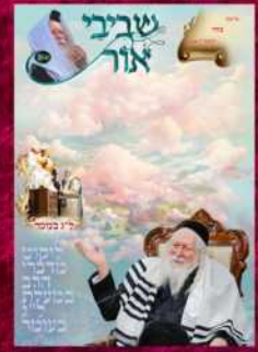
בשער: מורינו הרב