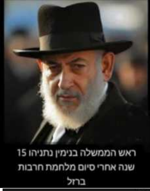
ראש הממשלה בנימין נתניהו 15 שנה אחרי סיום מלחמת חרבות ברזל

*רכב זה ביצע עבירה? וכשהוא עושה מצווה - גם מתעורר בך צורך עד להתקשר ולדווח?