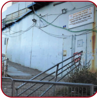
סביבי אנשים נמחצו למוות! מדרגות האסון

אלא בסכנת חיים כפשוטה. הבטתי סביב וקלטתי שהאנשים שמסביבי לא סתם מתלוננים על הצפיפות, אלא פשוט נפטרים לנגד עיניי. זה היה רגע מבעית. “ביסיעתא דשמיא אני הייתי בשורה הראשונה מעל למדרגות, כך שהלחץ לא היה ישירות עלי. סביבי אנשים נמחצו למוות, אבל אני בעצמי הייתי במעין בועה צדדית מוגנת. באותו רגע נשמעו ‘בומים’ חזקים. מצד שמאל שלנו מישוהו קיפל לאחור את לוחות הפח מכיוון המרכסת של הכנסת האורחים. איך שנפתח הפתח, הייתי בין הראשונים שיצאו ומיד חזרתי לעזור.”