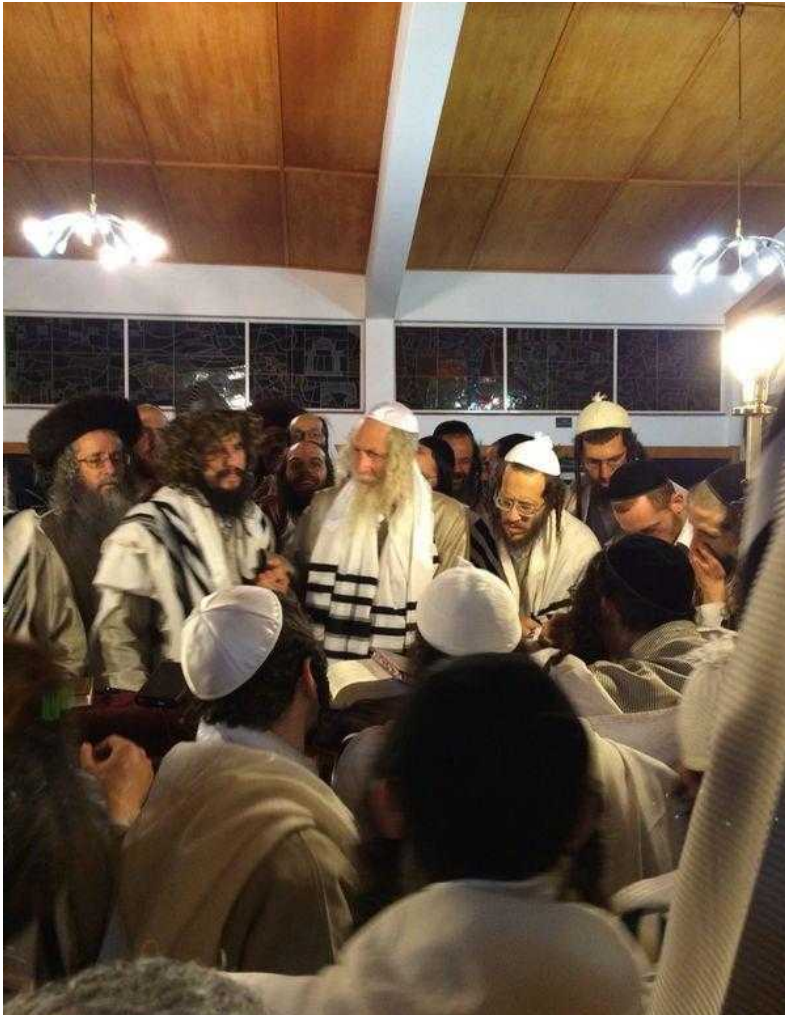
טורינו הרב פורים בויטבבואה לפני 10 שנים

יכולים להיות ערים עד שלוש וככה, הייתי מתבודד כליל שבת, בבוקר, אז הם משחקים קלפים, הייתי עושה התבודדות ברמת שרת, נווה שרת, רמת אלחנן, אז זה היה הכל חילונים שם, היינו מתבודדים, היה שם דיונות