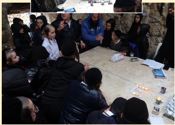
חשמונאים - קבר מתתיהו - תשפ"ד