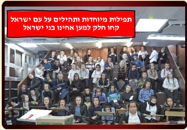
תפילות מיוחדות ותהילים על עם ישראל קחו חלק למען אחינו בני ישראל