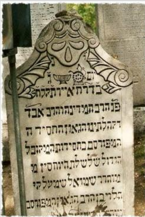
מצבת רבי שמואל שמלקי מניקולסבורג

משה לייב ציית למורו האהוב ואף רץ אחרי הגנב. הוא ידע כי משימתו היא אך ורק להעביר את המסר מאת הרב. רגליו הצעירות השיגו את צעדי הגנב ותוך זמן קצר תפס אותו ואמר לו את מה שאמר הרב.