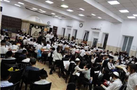
ילדי הצדיק בליל הושענא רבא – תשפ"ב