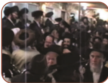
הגעתי להשתתף בהילולא, הילולת רבינו לפני שנים

"היה זה היה ביארצייט של רבינו הקדוש בשנת תשמ"א. הגעתי להשתתף בהילולא, ידעתי שרבי לוי יצחק ימסור שיעור, אבל לא חשבתי שיקרה משהו, כמו כל השיעורים שהייתי בא רק כי צריך להגיע. "אבל אז רבי לוי יצחק התחיל לדבר ואחרי מספר רגעים נפתח לי המעיין, הדיבורים פתאום פגעו בי, הדיבורים הפשוטים האלה. פתאום נפתח לי השכל להבין את העומק והלב שבכל דבר, העיניים שלו ממש בערו, קול חוצב להבות אש! עדיין לא הבנתי מה הוא אומר, אבל נפתח לי הלב כמו שאי אפשר לתאר. כל השיעור הסתכלתי עליו ובכיתי, הרגשתי שרבינו הקדוש מדבר מגורו, המילים שלו זה ברסלב, כל משפט שהוא מוציא מהפה זועק ברסלב, הבער אותה בלבי, זה ברסלב ולזה כספתי כל הזמן".