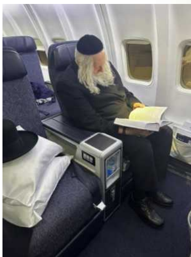
הפיוטים שלפני קדשה

וּפְרוּמָה מְשַׁנֵּי צְדָדֶיהָ וְרוֹחֶצֶת עִם בְּנֵי אָדָם עִם בְּנֵי אָדָם סִלְקָא דְעֵתָךְ אֲלֵא בְּמִקּוּם שְׁבִנֵי אָדָם רוֹחֲצִין זֶה מִצְוָה מִן הַתּוֹרָה לְגִרְשָׁה שְׁנֹאמֵר כִּי מִצָּא בָּהּ עֲרוֹת וְגו' וְשִׁלְחָה מִבֵּיתוֹ וְהִלְכָה וְהִיְתָה לְאִישׁ אַחֵר הַפְּתוּב קָרְאוּ אַחֵר לֹמֵר שְׂאִין זֶה בֶּן זֹגוֹ לְרֵאשׁוֹן זֶה הוֹצִיא רְשָׁעָה מִבֵּיתוֹ וְזֶה הַכְּנִים רְשָׁעָה לְתוֹךְ בֵּיתוֹ זָכָה שְׁנֵי שִׁלְחָה שְׁנֹאמֵר וְשִׁנְאָה הָאִישׁ הָאֲחֵרוֹן וְאִם לֹא קוֹבְרָתוֹ שְׁנֹאמֵר אוֹ כִּי יָמוּת הָאִישׁ הָאֲחֵרוֹן כְּדָאֵי הוּא בְּמִיתָה שְׁזָה הוֹצִיא רְשָׁעָה מִבֵּיתוֹ וְזֶה הַכְּנִים רְשָׁעָה לְתוֹךְ בֵּיתוֹ כִּי שְׁנֵי שִׁלַּח רַבִּי יְהוּדָה אוֹמֵר אִם שְׁנֵי שִׁלַּח רַבִּי יוֹחֲנָן אוֹמֵר שְׁנֵי שִׁלַּח רַבִּי פְּלִיגִי הָא בְּזוּג רֵאשׁוֹן הָא בְּזוּג שְׁנֵי דְאָמֵר רַבִּי אֲלַעְזָר כָּל הַמְּגִרְשׁ אִשְׁתּוֹ רֵאשׁוֹנָה אֲפִילוּ מִזְבַּח מוֹרִיד עָלָיו דְּמַעוֹת שְׁנֹאמֵר וְזֹאת שְׁנֵי תַעֲשׂוּ כַּפּוֹת דְּמַעָּה אֶת מִזְבַּח ה' בְּכִי וְאִנְקָה מֵאִין עוֹד פְּנוֹת אֶל הַמְּגִנְהָ וְלִקְחַת רִצּוֹן מִיְדְּכֶם וְאִמְרַתֶּם עַל מָה עַל כִּי ה' הֵעִיד בִּינְךָ וּבֵין אִשְׁתְּךָ גְּעוּרִיךָ אֲשֶׁר אִתָּה בְּגִדְתָּהּ בָּהּ וְהִיא חִבְרַתְךָ וְאִשְׁתְּ בְּרִיתְךָ.