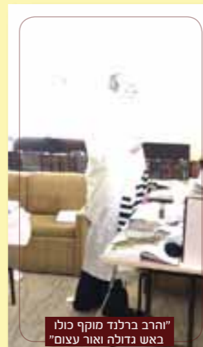
"הרב ברלנד מוקף כולו באש גדולה ואור עצום"

"ואז אומרים לי [לנשמה] אתה הולך לחזות כעת במסר נבואי אותו אתה חייב לפרסם לעם ישראל. ואני רואה במעלה ההר מצד ימין ניצבת מולי אישה ואני יודע שאני צריך לשמור את העיניים ולא להסתכל עליה. משמאלי קצת יותר למטה ניצב אחד ששקוע מאוד בתאוות ממון ואני צריך לשמור את עצמי שלא ליפול לתאוות הממון. אני מבחין שבעניין שמירת העיניים אני איכשהו מתגבר, אבל בתאוות הממון שכלולה בסוד בתאוות ניאוף נופלים יותר, וכל פעם שלא שומרים את העיניים או שנופלים בתאוות ממון מיד לא רואים את הצדיק, לא רואים את עם ישראל, הכל חשוך לגמרי, חשים תחושת צער נורא ואיום, ממש בדידות משועת. למעשה זה המסר שמבקשים