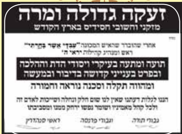
פשקוויל נגד משיח ה' ע"פ המדרש

"ועומד הקדוש ברוך הוא להוציא המשיח הוא בעצמו מבית האסורין שנאמר (תבוקק ג' א') יצאת ליטע עמך וכתוב (קהלת ד' יז) מבית אסורים יצא למלוך אלא כיון שיצא מבית האסורים ומסתכל בכל החיילות שנאספו עליו היה מזדעזע ואומר מי יכול לעמוד בכל החיילות האלו! באותו שעה מכניס חיילות מישראל ובא לבבל ומבקש רחמים וכל ישראל מבזים [אותם]. באותו שעה חוזרים ישראל לדעת אחרת ומבזים למשיח ואומרים 'אוי לנו שתעינו אחר משוגע זה' אומר להם הקדוש ברוך הוא