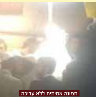
תמונה אמיתית ללא עריכה

של האדם תלוי בכך שהוא יתקרב לצדיק הדור, שאלתי את החברותא "מי זה צדיק הדור?" הוא ענה, "צדיק הדור זה הרב ברלנד שליט"א ללא