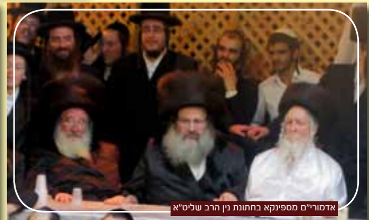
אדמו"רים מספינקא בחתונת נין הרב שליט"א