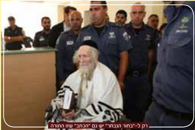
רק ל-"בחור הנבחר" יש גם "הכתב" שזו התורה

מסופר בגמרא (סנהדרין צח) שרבי יהושע הלך לחפש את משיח ושאל את אליהו הנביא "מה סימניה?" מהם סימניו? איך אני אכיר אותו? אמר לו אליהו "הוא יושב בין עניים סובלי חלאים, והוא נמי מנוגע דכתיב