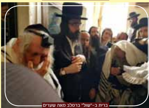
ברית ב-"שול" ברסלב מאה שערים